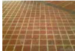
MEDIDA NOMINAL 10 cm. DE ANCHO Y 10 cm. DE LARGO.