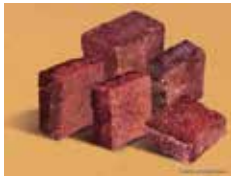
CORTE A GUILLOTINA

REAL TOPACIO® REGULAR CON PLANO NATURAL DE LA CANTERA DE 10 CM DE ANCHO POR 10 CM DE LARGO Y ESPESOR DE 5 a 8 CM. COLOR ROJO MIXTO. INSTALACIÓN PARA USO VEHICULAR EN ESPESOR DE 5 A 8 SE ASENTARÁ SOBRE UNA CAMA >2 Y < 5 DE ARENA JUNTEADO CON MORTERO ELABORADO CON PARTES IGUALES DE CEMENTO, AGUA Y ARENA CERNIDA CON ESPESOR >1 Y < 2 CM. INCLUYE SUMINISTRO, INSTALACIÓN, LIMPIEZA DE OBRA, CORTES CON CORTADORA, JUENTE Y LIMPIEZA FINAL.