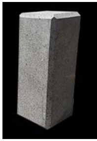
ALTURA DISTINTA DESDE 40 A 100 CM.