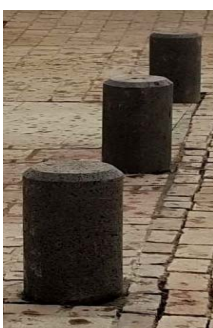
CORTE A DISCO

CONCEPTO DE OBRA PROTECCION PEATONAL EJE BOLLARDO MODELO _____ (CILINDRICO O OCHAVADO) ELABORADO DE ROCA DE RECINTO LAMINADO MARCA EJE CON MEDIDAS EN CENTIMETROS DE _____ (15 A 30) POR LADO Y _____ (60 A 100) DE ALTURA COLOR NEGRO DE PORO CERRADO CARA LISA (SIN MARCAS SENSIBLES AL TACTO DE DISCO DE CORTE). LA INSTALACIÓN SE REALIZARÁ EMPOTRANDO 20 % DE LA ALTURA TOTAL EN EL CUERPO DEL PAVIMENTO ADHIRIENDOLO CON EJE PEGA PIEDRA AGREGANDO A LA MEZCLA 1 LITRO POR BULTO DE 20 GK DE ADHESIVO EJE POLIMER CRETE. PARA PROTEGER DE MANCHAS Y HUMEDAD APLICAR 2 MANOS DE IMPREGNANTE JOBEN XXI PARA PROTEGER Y DAR UN ACABADO HUMEDO O SILICON JOBEN IX PARA DAR UN ACABADO INVISIBLE. INCLUYE SUMINISTRO, ADHESIVO, INSTALACIÓN, LIMPIEZA DE OBRA, SELLADOR Y APLICACIÓN DEL SELLADOR, CORTES CON CORTADORA, LIMPIEZA FINAL.