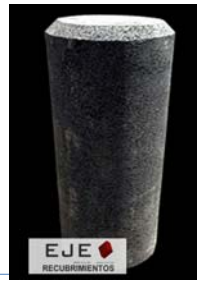
LARGOS DISTINTOS DE 15 HASTA 30 CM.