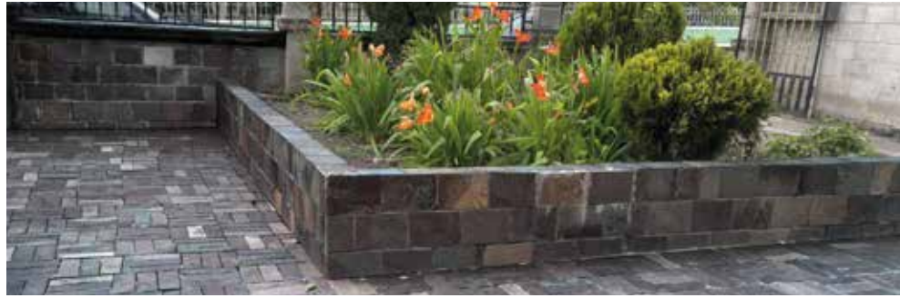
Uso Peatonal y en Fachadas