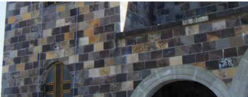
20 x LL / Uso en Fachadas