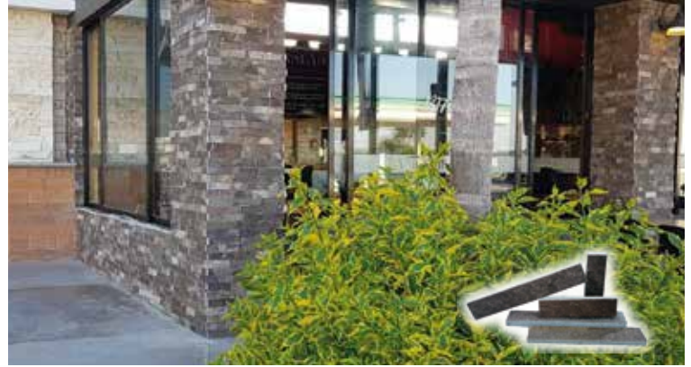
5 x LL / Uso en Fachadas