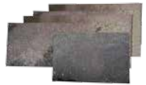
10 x 10 / Uso Peatonal y en Fachadas